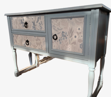
Kommode hellblau "Shabby-chic" Acryllack wasserbasiert Maße ca. 94 x 38 x 71 cm

jetzt: 272,00 € inkl. MwSt. (statt 340,00 €)