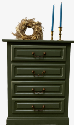
Kommode grün Kreidelack dunkelgrün Maße ca. 55 x 39 x 72 cm

Du suchst nach einer besonderen Kommode, die sonst niemand hat? Perfekt! Alle verfügbaren Kommoden sind ab sofort um 20% reduziert. Es lohnt sich! Bei Interesse komm gern vorbei oder melde Dich bei mir. Tel. 04521-8311540, Mail: info@doitlikebob.de