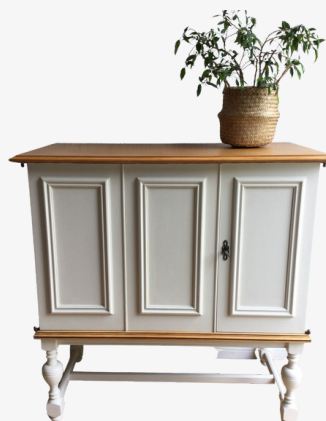
Kommode cremeweiß mit Holzplatte Acryllack wasserbasiert Maße ca. 92 x 47 x 92 cm

jetzt: 272,00 € inkl. MwSt. (statt 340,00 €)