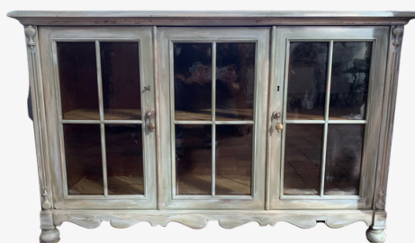
Kommode grün "Shabby-chic" Kreidelack dunkelgrün mit Acryl gold und weiß Maße ca. 114 x 38 x 72 cm

jetzt: 384,00 € inkl. MwSt. (statt 480,00 €)