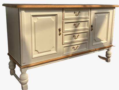
Kommode cremeweiß mit Holzplatte Acryllack wasserbasiert Maße ca. 113 x 39 x 68 cm

jetzt: 384,00 € inkl. MwSt. (statt 480,00 €)